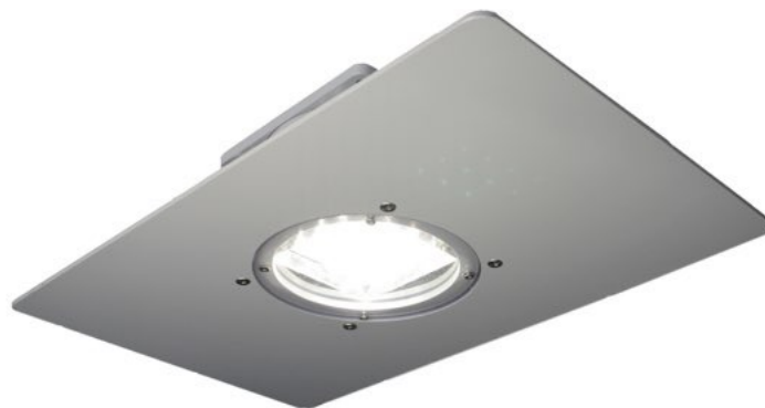
GF15 asennuskehyksellä ja PC-suojalevyllä